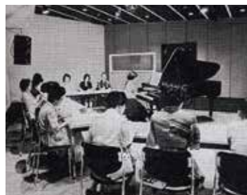
▲第1回目プレピティナ ヤングピアニスト オーディションの様子。緊張感が伝わってくる。