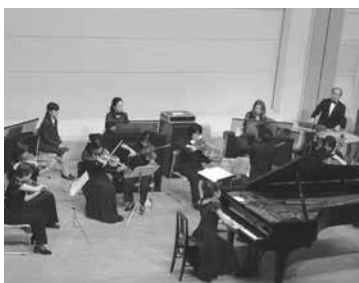
▲ 2004 年度までコンチェルト部門も開催されていた。