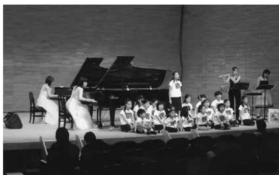
▲ソロで参加してもよし、他楽器とのアンサンブルもよし。コンペのリハーサルとしてステップを活用する例も多い。