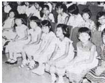
▲オーディション会場にて、演奏順番を待つピティナっ子たち。