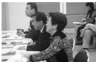
▲演奏を聴いて瞬時に適切なコメント(ステップ・メッセージ)を書くのは、コンペと変わらない大変な作業。

コンペでは「課題曲に対して貴方はどう弾いたか」、つまり課題曲の解釈、イメージ、テクニクの充実が感動に結びついているかを考えて書きます。ステッ