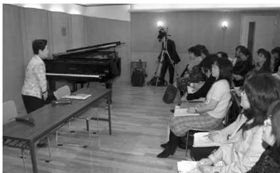
▲毎年全国各地で開催されるコンペ課題曲説明会。写真は課題曲発表当日（3月1日）に行われたセミナー（ヤマハ銀座店）。

子供のうちから、音楽を通じて世界を知って頂きたいということです。初期からロシア、フランス、スペイン等、様々な国の曲を入れています。また邦人作品を課題として加えたのは、1970年代当時としては大変画期的な