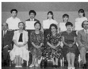
▲ 1991 年度シニア部門参加者と審査員の先生方。シニア部門はこれが第 2 回目。