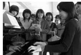
▼ステップでは多くの人が、自らの音楽を自由に表現。音楽を通じて人と出会う場でもある。

—最近ピティナ・ピアノステップや学校クラスコンサートなど、音楽を通じて人と人が出会う機会が増えました。今後はコンペを含めてあらゆる演奏の場を活用し、本来の意味での「競争」を通じて、自らの音楽の力を磨いて頂きたいですね。