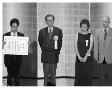
▲ 2005 年度特級邦人課題曲の表彰