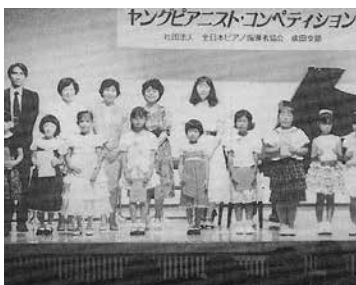
▲まだこの頃は「ピティナ ヤングピアニストコンペティション」だった。

さらに外部からの影響も多大で、特にピティナ・ピアノステップの出現(1997年～)とグランミュースの台頭