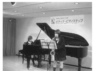
▲ステップは2006年度で10年目を迎える。