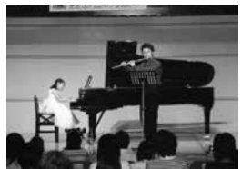
▲学校クラスコンサートには、特級グランプリや上位入賞者等が出演。小学生の素直な反応に、プロが刺激を受けることも。