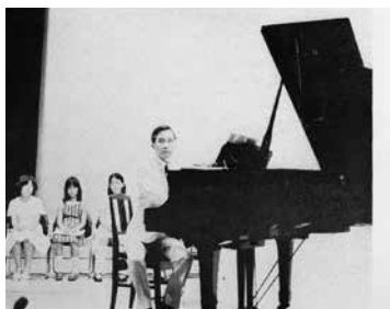
▲コンペが始まる以前、邦人作曲家の先生方を招いてのセミナー等がよく開かれていた。