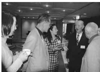
▲青山ステップ終演後、参加者同士で談笑。

一最近ソロ部門と グランミュージズ部 門を併願する人も 徐々に増えていま すが。